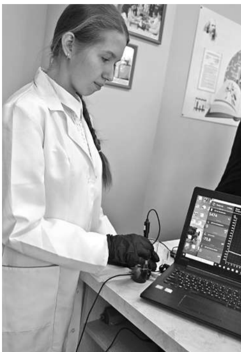
В школе № 1

КОЛЛЕГИ! МЫ ПРИГЛАШАЕМ ВАС СТАТЬ НЕ ТОЛЬКО ЧИТАТЕЛЯМИ, НО И АВТОРАМИ ГАЗЕТЫ!