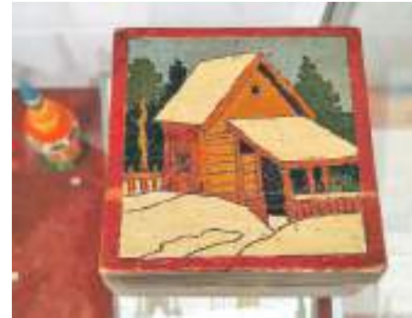
Шкатулка-коробочка «Зима в деревне» (1930-е гг.)