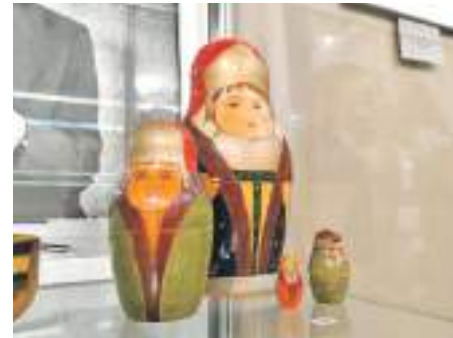
Набор матрёшек «Боярыни» (1910-е гг.)