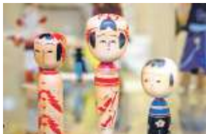
Японские куклы кокэси