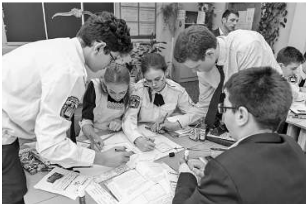
Заполнение ментальной карты