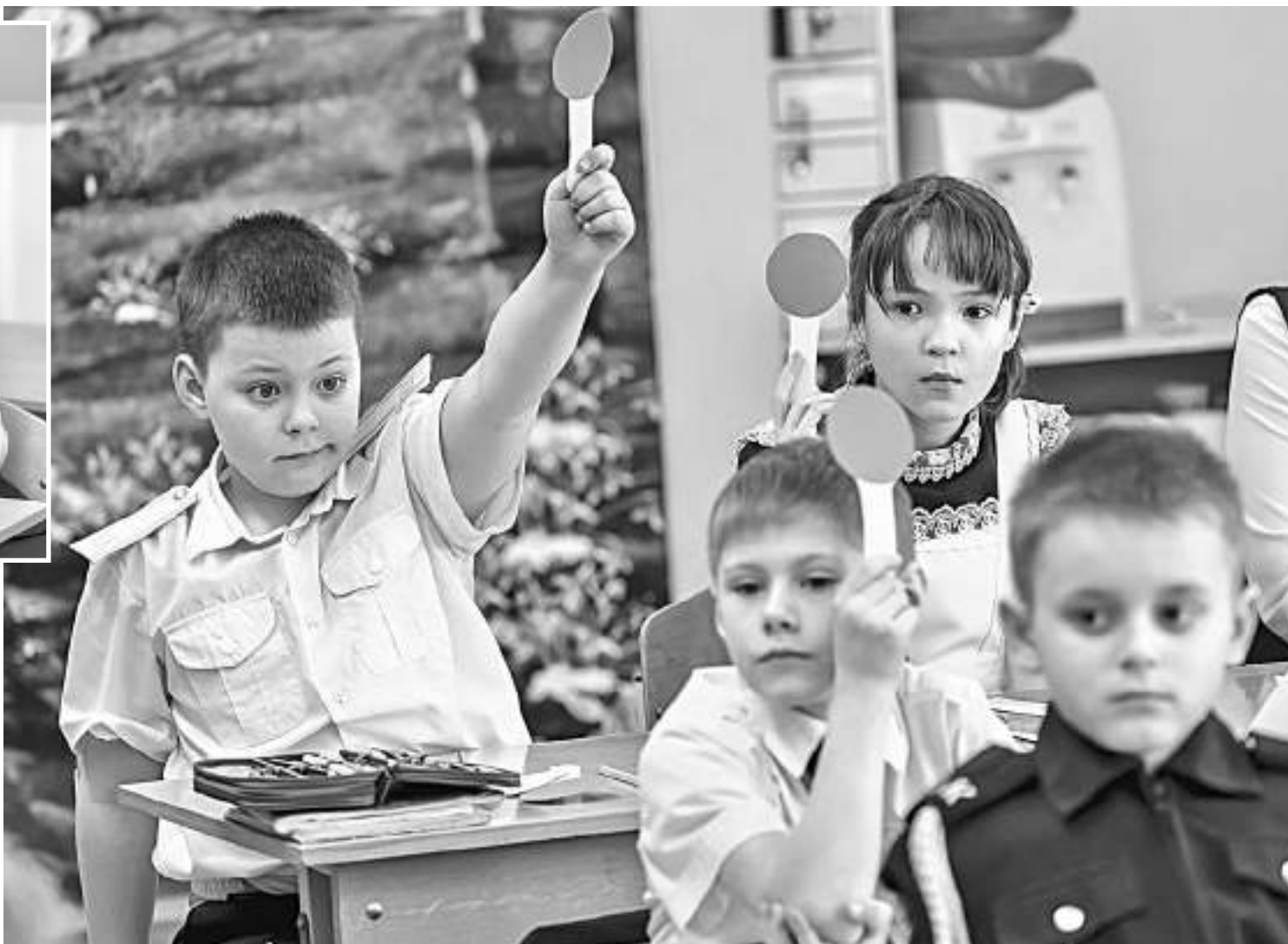
Использование техники «Светофор» в начальной школе

Задания разные: схемы, вопросы (в том числе в формате «допиши фразу или предложение») и даже ребусы. Выполнить их ребята должны за определённое