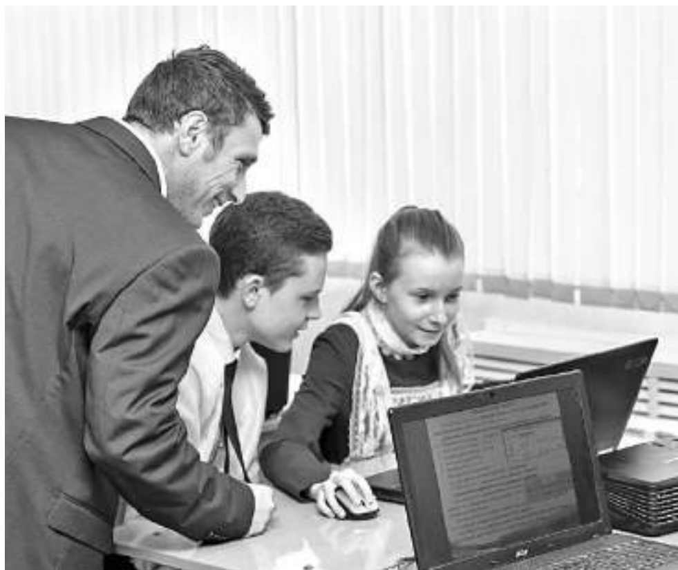
Ребята выполняют практическое задание на компьютере

Учитель раздаёт ребятам карточки с вопросами: «Чему я научился за эту неделю?», «Какие вопросы для меня остались неясными?», «Какие вопросы