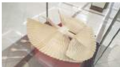
Архангельская щепная птица