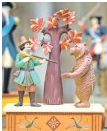
Деревянная игрушка «Охотник и медведь» мастера Олега Михайлова