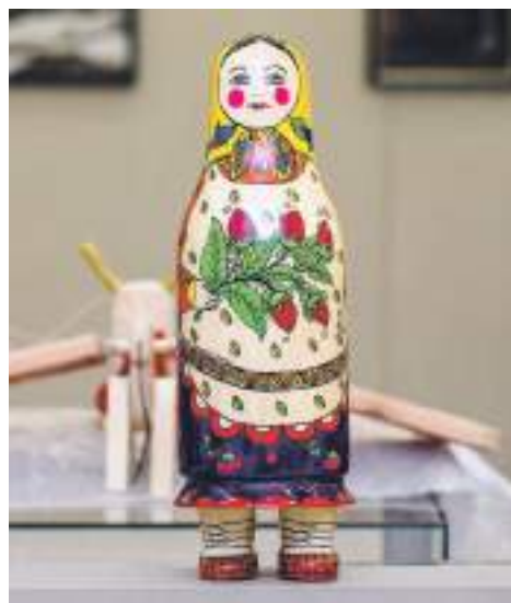
Матрёшка на ножках

А ещё на выставке вы увидите своеобразную «японскую матрёшку» — кокэси, характерная особенностью которой — цилиндрическое тело с прикреплённой головой и отсутствие рук и ног. Эти куклы, покрытые росписью, появились в Японии ещё в XVII веке и до сих пор пользуются огромной популярностью у японцев самого разного возраста. Любопытно, что заготовки для этой куклы делают в России!